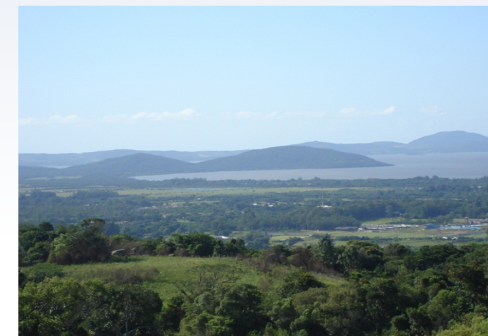
Morro São Pedro Zona Sul de Porto Alegre