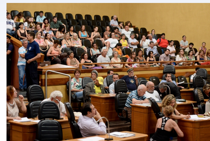
Câmara em debate sobre zonas rurais

Ao final da reunião, a Comissão de Saúde e Meio Ambiente comprometeu-se a resgatar projetos da zona rural com a finalidade de discutir, nos próximos encontros, projetos de lei que abordam o tema. Foi encaminhado também um ofício para que a Empresa Pública de Transporte e Circulação (EPTC) faça rondas durante os finais de semana no morro São Pedro, no intuito de flagrar motoqueiros que circulam pelo local de forma imprópria e sem placa de identificação. Além disso, a Cosmam irá solicitar à Delegacia do Meio Ambiente a proteção e segurança dos moradores ameaçados por grileiros.