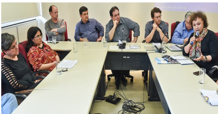
Vereadores ressaltaram necessidade de diálogo com professores

A fim de discutir o cenário pós-greve dos municipais na área da educação, a Comissão de Defesa do Consumidor, Direitos Humanos e Segurança Urbana (Cedecondh) recebeu na Câmara Municipal de Porto Alegre, no dia 5 de julho, professores que aderiram à paralisação, encerrada na última semana, e representantes da Secretaria Municipal de Educação (Smed).