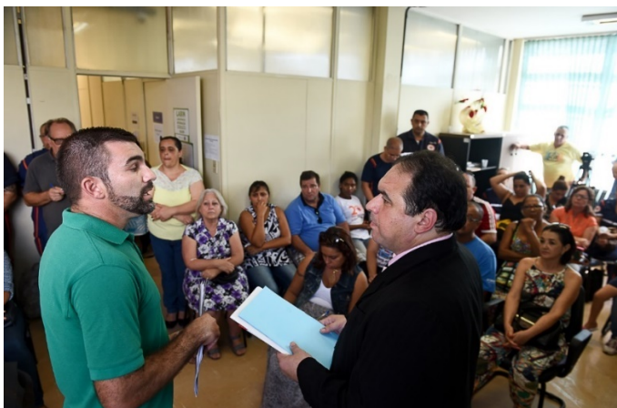
Servidores e a insegurança para trabalhar

Uma sessão conjunta das Comissões de Saúde e Meio Ambiente (Cosmam) e de Defesa do Consumidor, Direitos Humanos e Segurança Urbana (Cedecondh), da Câmara Municipal de Porto Alegre, reuniu vereadores, comunidade e servidores no Pronto Atendimento da Vila Cruzeiro do Sul (Pacs) no dia 8 de março. Na pauta, os recentes tiroteios e invasões do Pacs, envolvendo integrantes da guerra do tráfico, bem como a falta de segurança e a ausência de um plano de proteção aos servidores e pacientes.