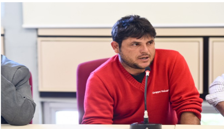
Soares disse que 32 famílias de recicladores estão sem trabalho

No dia 27 de setembro os vereadores receberam a comunidade Beira do Rio, do Bairro Humaitá. A reivindicação dos moradores dizia respeito à regularização e instalação de um galpão para a reciclagem de resíduos sólidos na localidade, que fica na zona Norte de Porto Alegre.