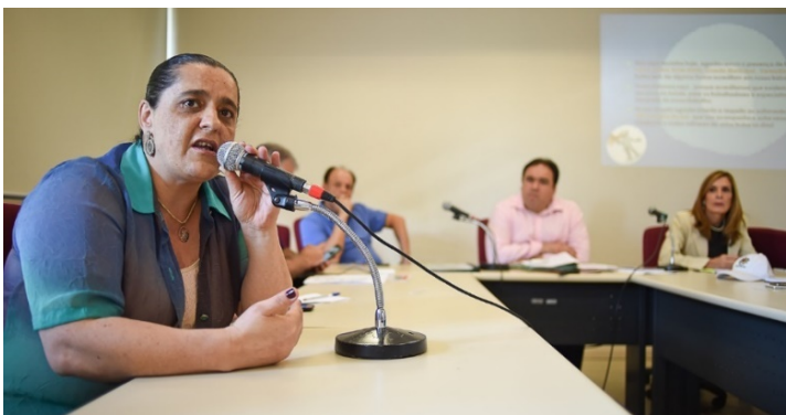
Faltou a CPI

A segurança para usuários e profissionais da saúde no Pronto Atendimento Cruzeiro do Sul (Pacs) voltou a ser discutida em pauta da Comissão no dia 15 de março. É que nos últimos meses, o posto se manteve fechado por alguns períodos, devido à ocorrência de conflitos armados próximo ao local e até mesmo no interior da unidade de saúde.