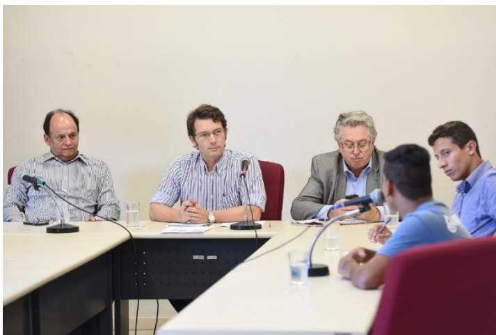
Estudantes sem transporte escolar

Em 22 de março, a comissão discutiu o Programa Vou à Escola, direcionado para jovens de baixa renda da Capital. Na ocasião, estavam presentes representantes da União Gaúcha dos Estudantes Secundaristas (Uges), do Ministério Público e da União Metropolitana dos Estudantes Secundários de Porto Alegre (Umespa).