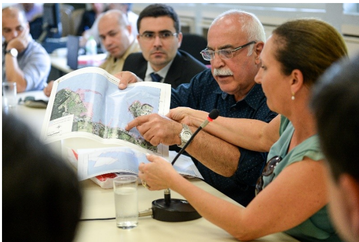
Levantamento comprova irregularidades

Moradores da Associação Estrada Retiro da Ponta Grossa (Amoerp) debateram o Corredor Ecológico projetado para o bairro e as zonas de alagamento provocadas pelo aterramento e ocupação de um terreno paralelo ao Arroio do Salso, que deságua na região.