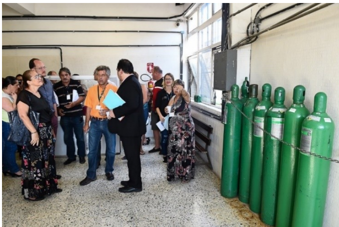
Tubos de oxigênio na linha de tiro