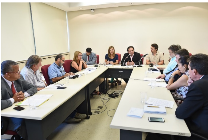
Reunião avaliou consequências do temporal de janeiro