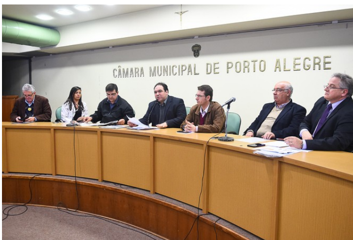
Reunião foi decisiva para evitar o fechamento

Assim como evitar o fechamento do Hospital Parque Belém, deixando a população com uma casa de saúde a menos em Porto Alegre, a ação da Cedecondh para evitar o fechamento e pela manutenção do Senai Restinga foram duas das ações de mobilização dos vereadores para salvar dois patrimônios prestadores de serviço da capital. O primeiro na área da saúde, o segundo na educação.