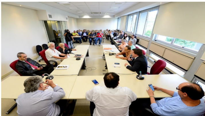
Rede colaborativa precisa ser acionada

O grande objetivo do encontro foi traçar metas conjuntas e construir uma rede colaborativa, composta entre os poderes públicos municipal e estadual e as entidades representativas, para promover e incentivar a inclusão social dos idosos e melhorar a acessibilidade na Capital, impulsionando qualidade de vida e novos estatutos, visando ao amparo e à proteção dos mesmos.