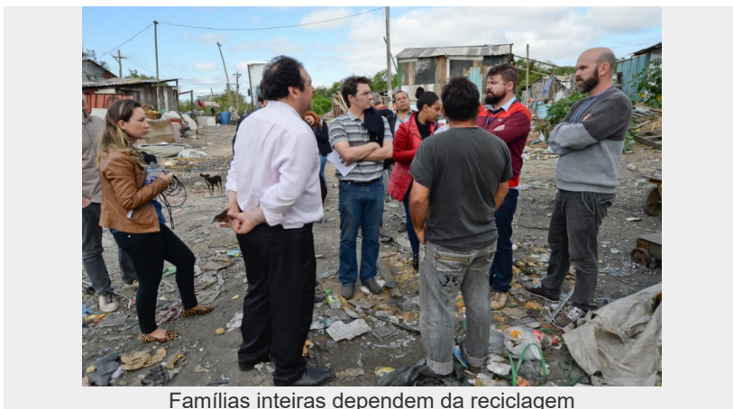
Famílias inteiras dependem da reciclagem

A comunidade da vila Beira do Rio, no bairro Humaitá, passa por um momento de dificuldades por não conseguir exercer sua principal atividade remunerada, a reciclagem. A maior parte dos moradores sempre trabalhou como catador, mas, com a proibição da circulação de carroças, não consegue mais atuar nessa atividade. Ao mesmo tempo, não se sentem contemplados pelas alternativas oferecidas pela Prefeitura para formação e geração de renda disponíveis e buscam regularizar uma usina de triagem própria. No entanto, devido à falta de verbas, a estrutura não é suficiente para receber os materiais provenientes da coleta seletiva feita pelo Departamento Municipal de Limpeza Urbana (DMLU).