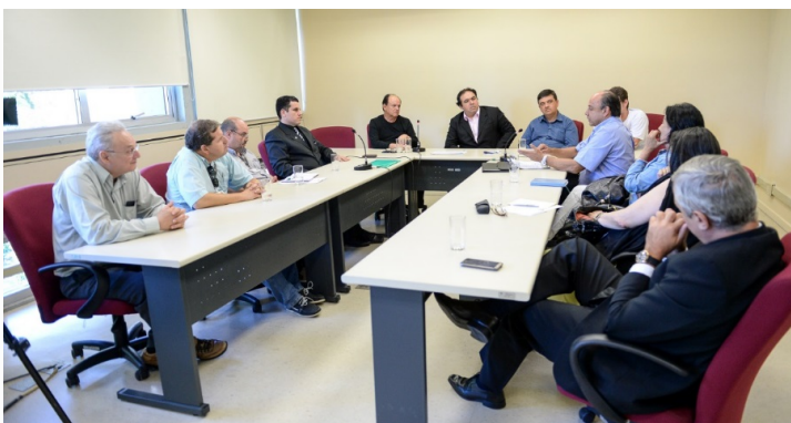
Entidades ligadas a defesa do consumidor e direitos humanos participaram da sessão

A operação Leite Compensado e seus desdobramentos foi o assunto da reunião da Comissão de Defesa do Consumidor, Direitos Humanos e Segurança Urbana (Cedecondh) da Câmara Municipal de Porto Alegre em 29 de novembro. A preocupação com as fraudes no leite consumido pelos gaúchos esteve presente nas falas dos vereadores e dos representantes das entidades que participaram do encontro.