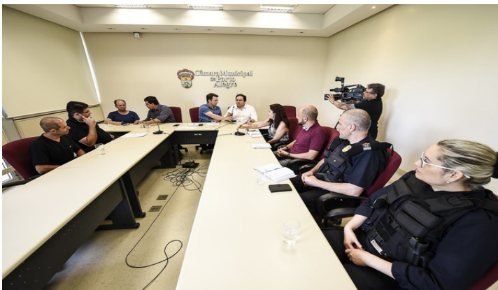
Cedecondh pedirá que Executivo defina o número de novos guardas municipais necessários