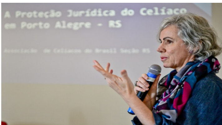
Ester lembrou que corpo de celíaco não tolera a mínima quantidade de glúten

No dia 13 de setembro, o debate na Cedecondh foi em torno da proteção jurídica ao portador de doença celíaca (intolerante ao glúten) em Porto Alegre. O encontro marcou o primeiro Dia Municipal do Celíaco, após a aprovação, pelo legislativo, do Projeto de Lei que instituiu a data.