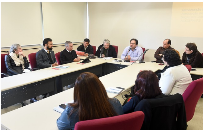
Entidades fazem proposta de regulamentação da Lei para apresentar aos estabelecimentos

“O Procon já se disponibilizou a auxiliar a Acelbra e isso já resultou em quatro processos administrativos. Segundo ele, a falta de informação qualificada é a principal causa do descumprimento da lei por parte dos estabelecimentos.