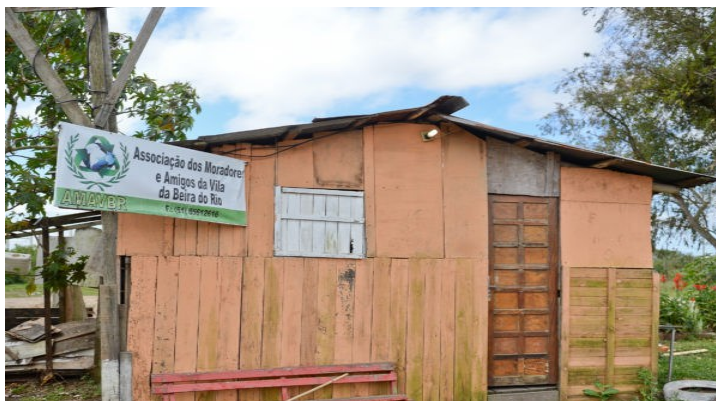
Galpão de reciclagem improvisado construído pela comunidade da Vila Beira do Rio