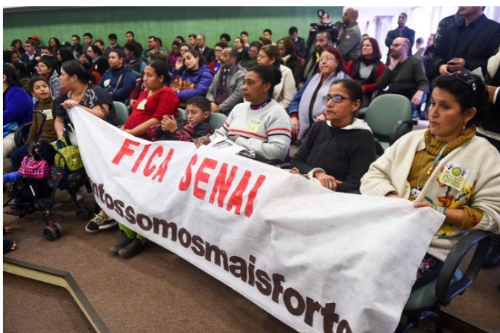
Senai da Restinga existe há 40 anos

Criado em 1976, o Senai Restinga atende 80 alunos por ano possibilitando formação profissional aos jovens do bairro e é uma parceria entre o Senai e a Prefeitura. A escola oferece gratuitamente os cursos de manutenção elétrica, básico em madeira e mobiliário e eletricitista instalador predial. A causa para o possível fechamento é a necessidade de adequação do prédio, cedido pela prefeitura, às normas de acessibilidade e ao Plano de Prevenção e Proteção contra Incêndio (PPCI). O custo para as reformas é de R$ 480 mil e o impasse está em quem irá arcar com as despesas.