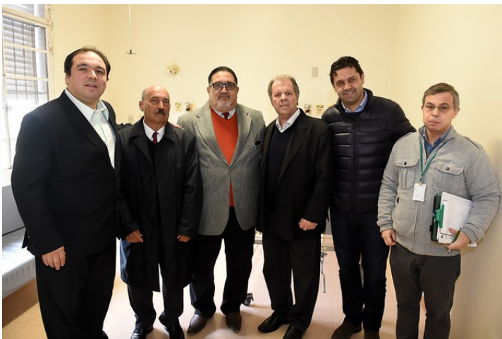
Secretaria da Saúde voltou atrás sobre a decisão