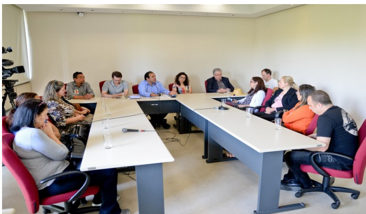
Comissão reuniu funcionários e representantes do governo municipal

A Comissão de Defesa do Consumidor, Direitos Humanos e Segurança Urbana (Cedecondh), da Câmara Municipal de Porto Alegre, realizou no dia 11 de outubro, reunião com técnicos em enfermagem que estão passando por problemas de progressão de categoria há quase dois anos. Autoridades municipais também participaram do encontro.