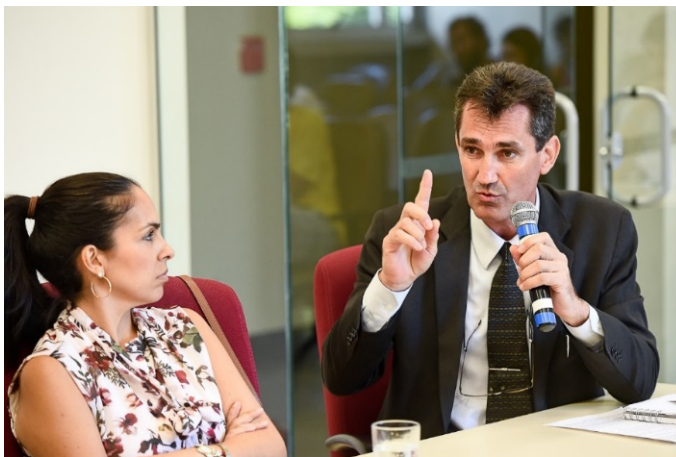
Operadoras criaram grupo de WhatsApp