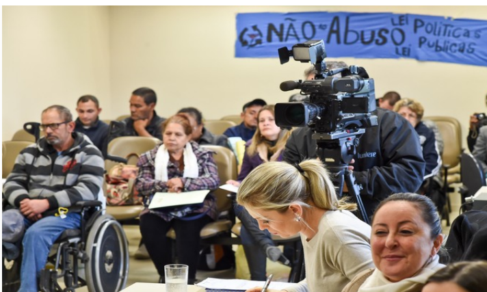
Queixas foram levadas à comissão

Em reunião realizada no dia 2 de agosto, a Comissão de Defesa do Consumidor, Direitos Humanos e Segurança Urbana (Cedecondh) recebeu uma série de demandas que envolvem as dificuldades das pessoas em situação de rua. O encontro na Câmara Municipal de Porto Alegre abordou desde casos de violência policial até problemas no Restaurante Popular.