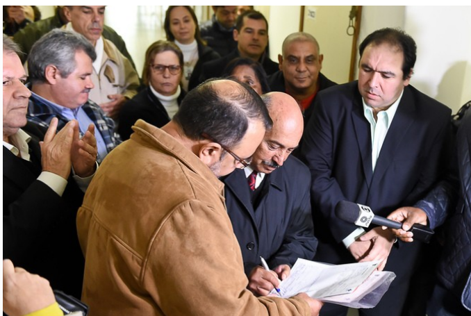
Ação rápida evitou que pacientes internados no HPB ficassem sem atendimento