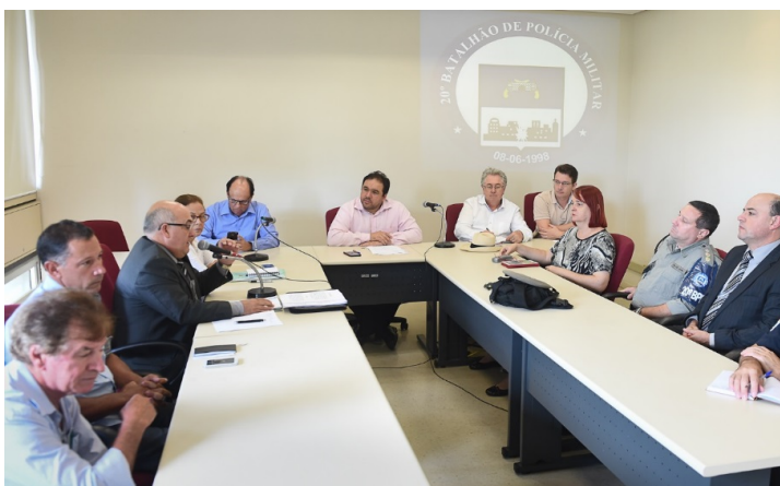
Culpa pela insegurança é a falta de efetivo

Representantes da Brigada Militar e moradores dos bairros Lindóia, São Sebastião e Ipanema, foram à Câmara no dia 29 de março para denunciar à Cedecondh falta de segurança e a situação dos postos de policiamento nos bairros.